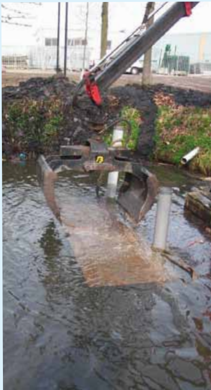
De plaatsing van een Mudtrap.

afgevangen bagger schoner is en daardoor beter herbruikbaar. De bagger uit de Mudtrap is bruikbaar op land in de directe omgeving. Een voorbeeld van het benutten van de afgevangen bagger is Topsurf: een product dat wordt ontwikkeld voor de compensatie van bodemdaling in veenweidegebieden.